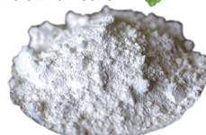
ケイ酸カルシウム

この固形石鹸は、水・熱を一切加えず真空加圧製法にて一つ一つ手作業で出来ています。押し固める圧力は 90 トンという途方もない圧力で固形にしていますので、湿気が多いお風呂場でも柔らかくならず溶けたりしないのが特徴です。