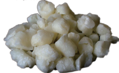
パームヤシ油 石鹸素地