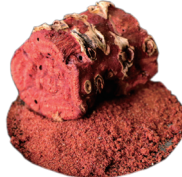
コウケイテン根エキス